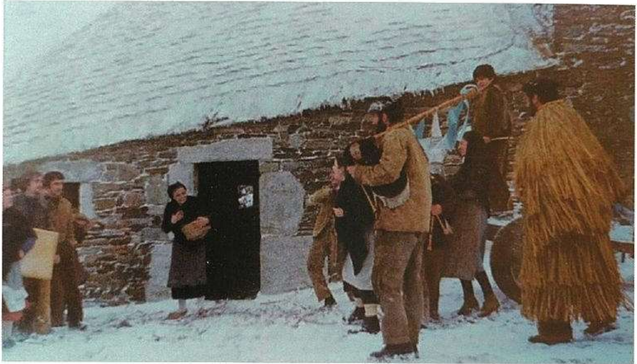
La representación celebrada en O Cebreiro en 1976 para la serie Galicia canta ao neno , de TVE

también, y de ahí su mérito extraordinario, en revivir e insuflar nuevo aliento a los "Cantares de Reises" de Hospital da Condessa o a los brindos o regueifas (duelos poéticos que, con ecos de cierta influencia andalusí, se conservan en algunas partes de Galicia), costumbres que permanecían vivas aún en el recuerdo de las personas de más edad, últimos ecos de la riqueza cultural que hubo en estas montañas.